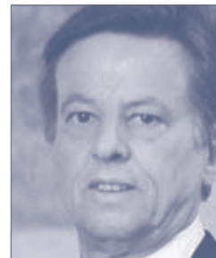
Josef Sylle Sylle Versicherungsmakler GesmbH & Co KG Kooperationspartner der Koban Südvers Group Austria