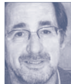
Regierungsrat Rainer Ottowitz Abteilung 7 – Wirtschaftsrecht und Infrastruktur