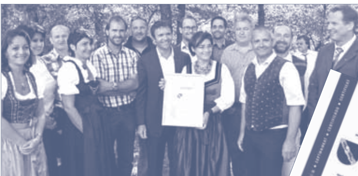
Energieteam Bad Eisenkappel mit LR in Prettner

Damit die Bemühungen umfassend und dauerhaft sind, wurde nach einer Systematik gesucht, mit der die Energieprobleme langfristig und strukturiert bewältigt und nicht durch kleine Hindernisse aufgehalten werden. Bereits nach den ersten Monaten wurde eine Vielzahl von Verbesserungsmaßnahmen gesetzt. Zum erfolgreichen Abschluss wurde Bad Eisenkappel im Juli 2011 – weltweit erstmals – vom „Technischen Überwachungsverein“ (TÜV) das ISO 50001-Zertifikat verliehen. Die Zertifikatsurkunde wurde vom Umweltminister DI Nikolaus Berlakovich sowie der Energiereferentin des Landes Kärnten, Frau LR in Dr. Beate Prettner, am 16. 8. 2011 der Gemeinde übergeben.