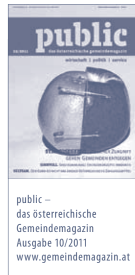
public – das österreichische Gemeindemagazin Ausgabe 10/2011 www.gemeindemagazin.at

Die Schweizer nehmen es auf jeden Fall gelassen, getreu ihrer fast liebsten Redewendung: Jedes Problemlü het zwöi Siite: die fauschi ond üsi. – Jedes Problem hat zwei Seiten: die falsche und unsere. ■