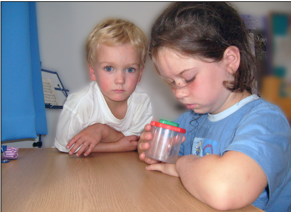
Abbildung 1: Kinder beim Studium einer Assel über das Okular einer Becherlupe

Asseln sind mehrjährige Lebewesen und sehr gute Bioindikatoren für die Hintergrundbelastung mit Schwermetallen. Um den Kindern die Möglichkeit zu geben, im Projekt aktiv mitzuarbeiten, wurden gemeinsam mit ihnen und ihren Lehrern/Lehrerinnen im Schulbereich pro Schule rund 20 Asseln gesammelt. Im Klassenzimmer wurden dann Becherlupen bestückt mit je einer lebenden Assel verteilt, womit die Kinder die Asseln sowohl von der Rückenseite als auch von der Bauchseite inspizieren konnten. Anhand eines Posters wurde erklärt, was Luftverschmutzung ist, wie eine allfällige Verschmutzung in der Umwelt verbreitet wird, und wie Schule und Kinder betroffen sein können.