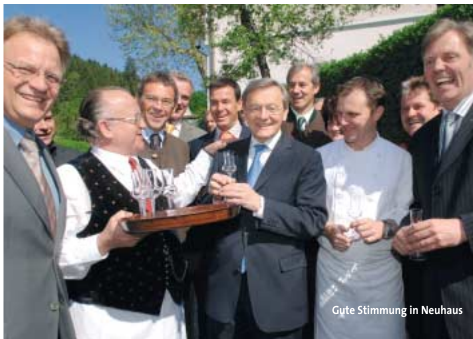
Gute Stimmung in Neuhaus

Mit einer Verfassungsgarantie kann gewährleistet werden, dass eine Neufassung des