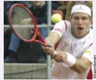
Jürgen Melzer fightet für Österreich im Davis Cup