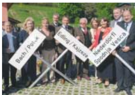
In Ludmannsdorf wurden in drei Ortschaften topographische Bezeichnungen aufgestellt

Topographieverordnung 1977: Topographische Bezeichnungen sind in Ortschaften mit mehr als 25 Prozent Volksgruppenangehörigen zweisprachig anzubringen. Eine Verfassungsgarantie soll nun sicherstellen, dass eine Neuregelung nicht wieder von Einzelnen angefochten werden kann.