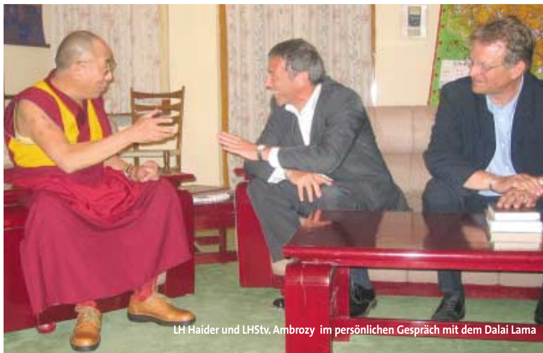
LH Haider und LHStv. Ambrozy im persönlichen Gespräch mit dem Dalai Lama