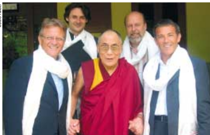
Die Kärntner Delegation beim Dalai Lama: LH Haider, LHStv. Ambrozy, Bgm. Schratzer, Projektbetreiber Rogner jun.

Das Projekt des europäischen Tibet-Zentrums, das sich der tibetischen Medizin, Spiritualität und Kultur widmen soll, sieht ein Kloster mit angeschlossenem Hotel vor. Gedacht ist auch an ein Institut für Tibetische Medizin und Philosophie unter Einschluss von Universitäts-, Forschungs- und Krankenhaus-Einrichtungen. In religiöser Hinsicht stellt man sich eine Art Kooperation mit dem Bistum Gurk vor, denn der Kärntner Bischof Alois Schwarz hat bereits Interesse angemeldet, mit in das Projekt eingebunden zu werden. Die Investitionen liegen bei 65 Mio. Euro, rund 400 neue Arbeitsplätze werden entstehen. ■