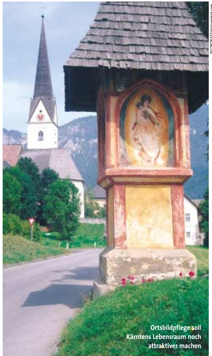
Ortsbildpflege soll Kärntens Lebensraum noch attraktiver machen