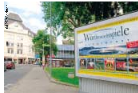
Rolling Boards gegen Reizüberflutung der Verkehrsteilnehmer

Produktion der ausgestellten Sujets für den laufenden Betrieb in St. Veit/Glan erfolgt. ■