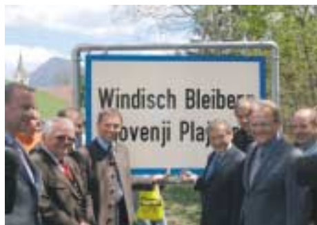
BK Schüssel und die Landesregierungsmitglieder bei der Aufstellung in Windisch-Bleiberg