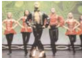
„Festival des Steptanzes“ am 24. und 25. Juni 2006