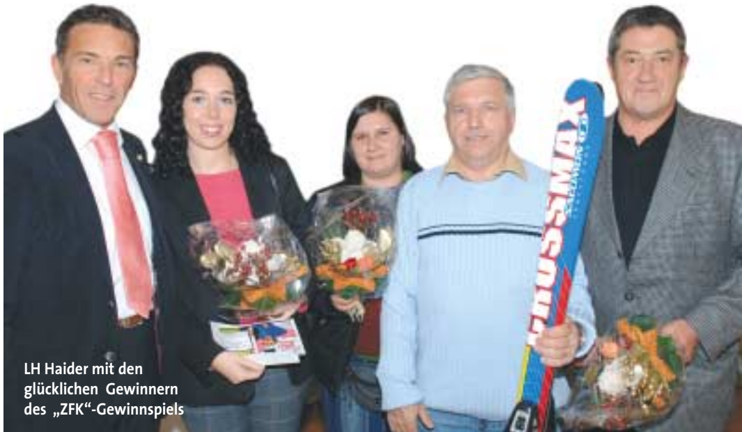
LH Haider mit den glücklichen Gewinnern des „ZFK“-Gewinnspiels

K ärntens Top-Schigebiete in vollen Zügen genießen können jetzt auch die Gewinner des letzten „Zeit für Kärnten“-Gewinnspiels. Landeshauptmann Jörg Haider über-