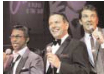
„The Rat Pack – Live from Las Vegas“ vom 4.-6. August 2006