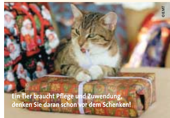
Ein Tier braucht Pflege und Zuwendung, denken Sie daran schon vor dem Schenken!