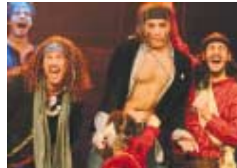
„Hair“ vom 18.-21. Juli 2006