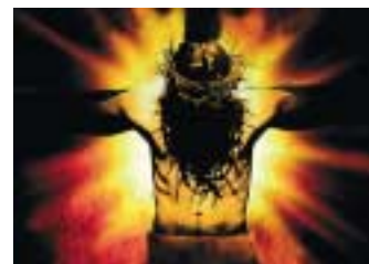
„Jesus Christ Superstar“ vom 11.-13. August 2006