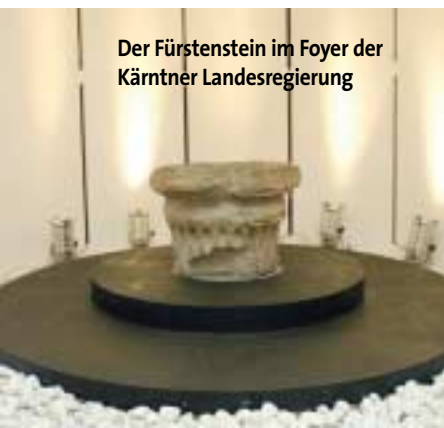
Der Fürstenstein im Foyer der Kärntner Landesregierung

Landhauses in Klagenfurt, dem Sitz des Kärntner Landtags, aufgestellt werden. Der Fürstenstein ist niemals ein nationales oder nationalistisches Symbol gewesen, sondern eines der Landeseinheit Kärntens, so Haider. Im Hinblick auf die jüngste Fürstensteindiskussion stellte er klar, dass dieses Symbol nicht auf slowenische Euromünzen geprägt werden sollte. Auch im größeren Europa ist daran zu appellieren, landeseigene Symbole gegenseitig zu respektieren. Der Fürstenstein spielte bei den Einsetzungszeremonien der Kärntner Herzöge eine erstrangige Rolle. Er stand nahe der Pfarrkirche von Karnburg, bis er 1862 vom Geschichtsverein für Kärnten erworben wurde. Bis 1905 stand er im Großen Wappensaal des Landhauses, danach in der Aula des Landesmuseums. ■