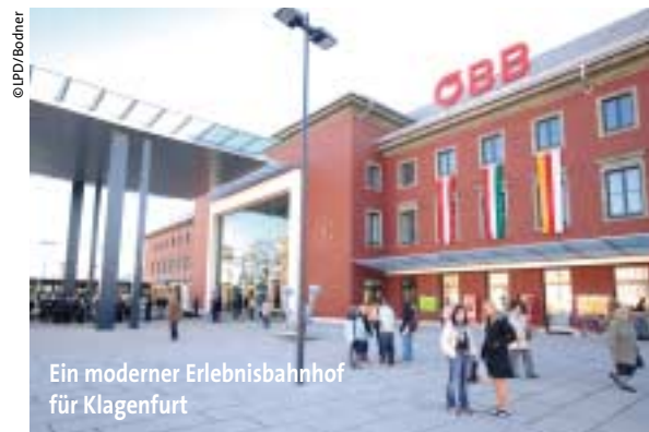
Ein moderner Erlebnisbahnhof für Klagenfurt