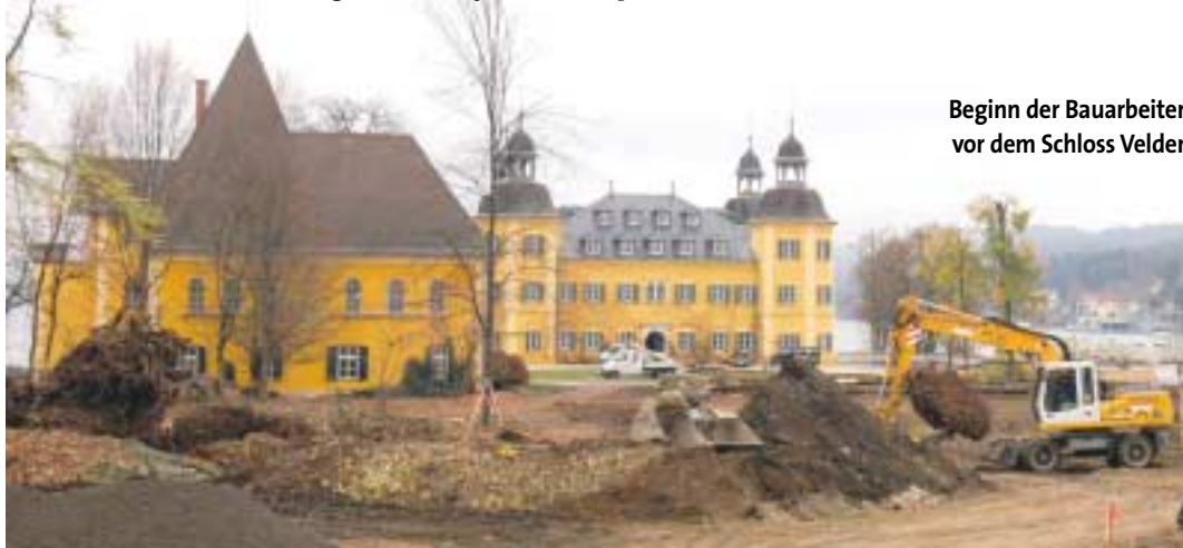
Beginn der Bauarbeiten vor dem Schloss Velden

Infos unter www.residenzenschlossvelden.com