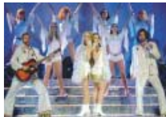
„Abbafever“ vom 6.-8. Juli 2006