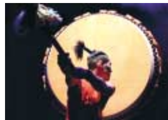
„Yamato – The Drummers of Japan“ vom 10.-12. Juli 2006