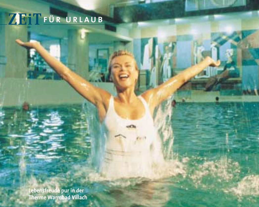
Lebensfreude pur in der Therme Warmbad Villach