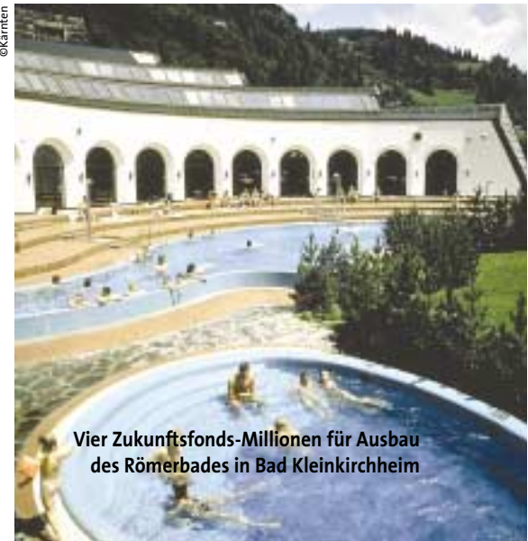
Vier Zukunftsfonds-Millionen für Ausbau des Römerbades in Bad Kleinkirchheim