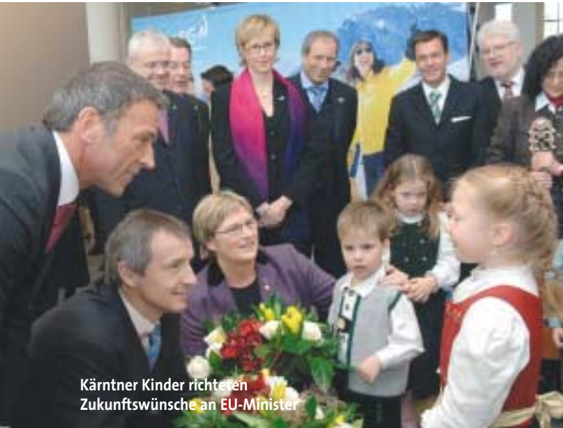
Kärntner Kinder richteten Zukunftswünsche an EU-Minister