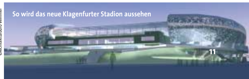
So wird das neue Klagenfurter Stadion aussehen

Tourismuskörner erschlossen werden. Die italienische Fußballnationalmannschaft wird mit Kärnten-Logos auf ihren Dressen für unser Bundesland Werbung machen, nannte der Tourismusreferent nur eine der vielen Werbeinitiativen. Auch ÖFB-Präsident Friedrich Stickler zeigte sich überzeugt, dass Kärnten und Klagenfurt mit der Übertragung der drei EM-Spiele in den Blickpunkt der Weltöffentlichkeit rückt. ■