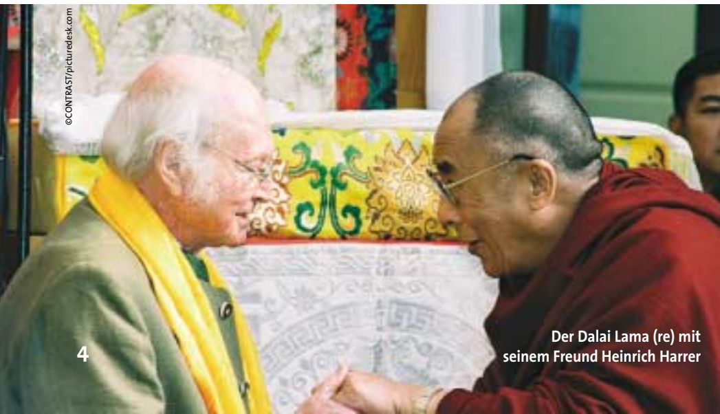
Der Dalai Lama (re) mit seinem Freund Heinrich Harrer

Viel tut sich derzeit auch am Wörthersee. Das Schloss Velden wird aus dem Dornröschenschlaf erweckt, das Veranstaltungszentrum Velden wird demnächst eröffnet, die Gesundheitsinsel Maria Wörth ist im Entstehen und das Managerzentrum Reifnitz nimmt konkrete Formen an. Erfolgreiche Premieren in Deutschland feiert derzeit auch die TV-Produktion „Der Arzt vom Wörthersee“ mit der Region in einer eindrucksvollen Hauptrolle. ■