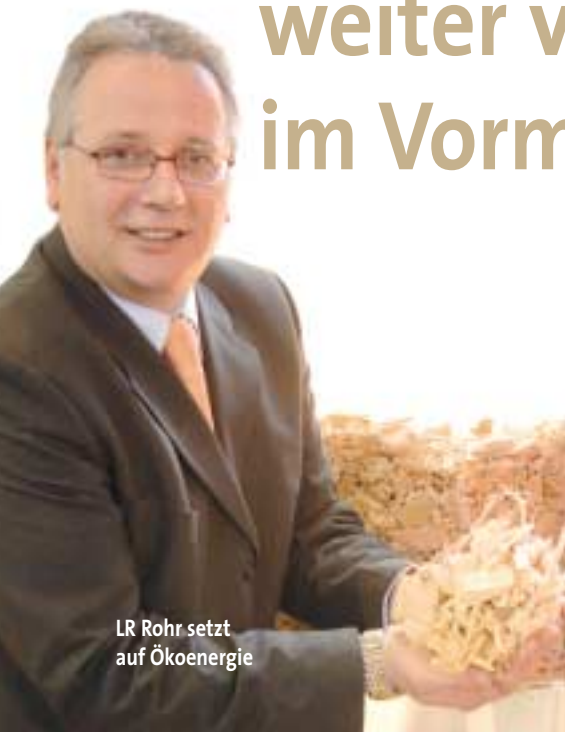
LR Rohr setzt auf Ökoenergie