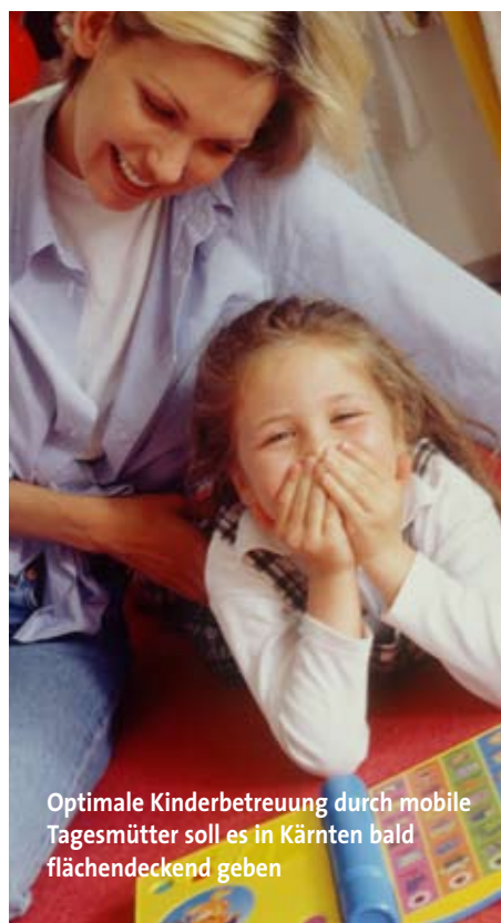
Optimale Kinderbetreuung durch mobile Tagesmütter soll es in Kärnten bald flächendeckend geben