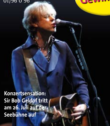
Konzertsensation: Sir Bob Geldof tritt am 26. Juli auf der Seebühne auf