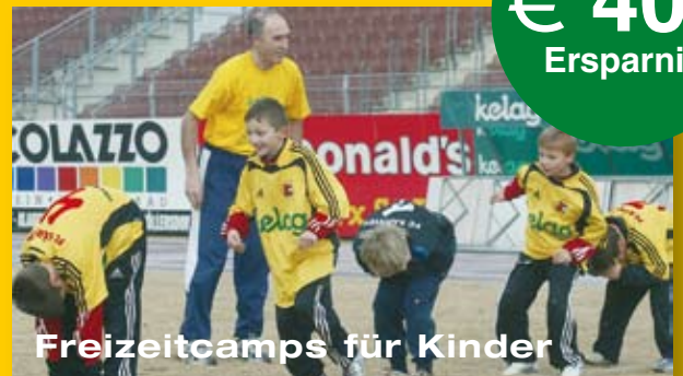
Freizeitcamps für Kinder

Das Kärntner Fußballnachwuchscamp bietet Kindern im Alter von 7 – 14 Jahren Ferienspaß an den schönsten Plätzen in Kärnten. Infos – www.plusclub.at ; www.fnc.cc