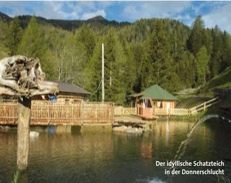
Der idyllische Schätzteich in der Donnerschlucht