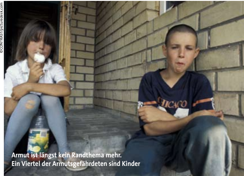
Armut ist längst kein Randthema mehr. Ein Viertel der Armutsgefährdeten sind Kinder

von akuten Notlagen Betroffenen dabei zu unterstützen, sich wieder eine eigenständige Existenzsicherung durch eigene Erwerbstätigkeit aufzubauen. ■