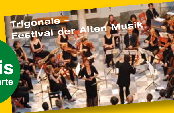
Trigonale – Festival der Alten Musik

Beim Kauf einer Eintrittskarte gibt es mit dem PlusClub-Joker eine Karte gratis dazu – bei allen Veranstaltungen der Trigonale bis 9. Juli 2006. Infos – www.plusclub.at .