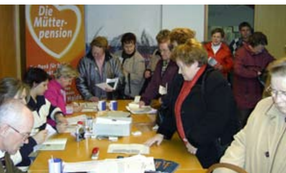
Bereits Ende 2005 wurde das Müttergeld in Form einer Einmalleistung zu je 150 Euro an über 11.000 Kärntner Mütter ausbezahlt

Kärntens Mütter, Babys und Schüler bekommen mehr Geld. Mobile Tagesmütter für bessere Vereinbarkeit von Familie und Beruf