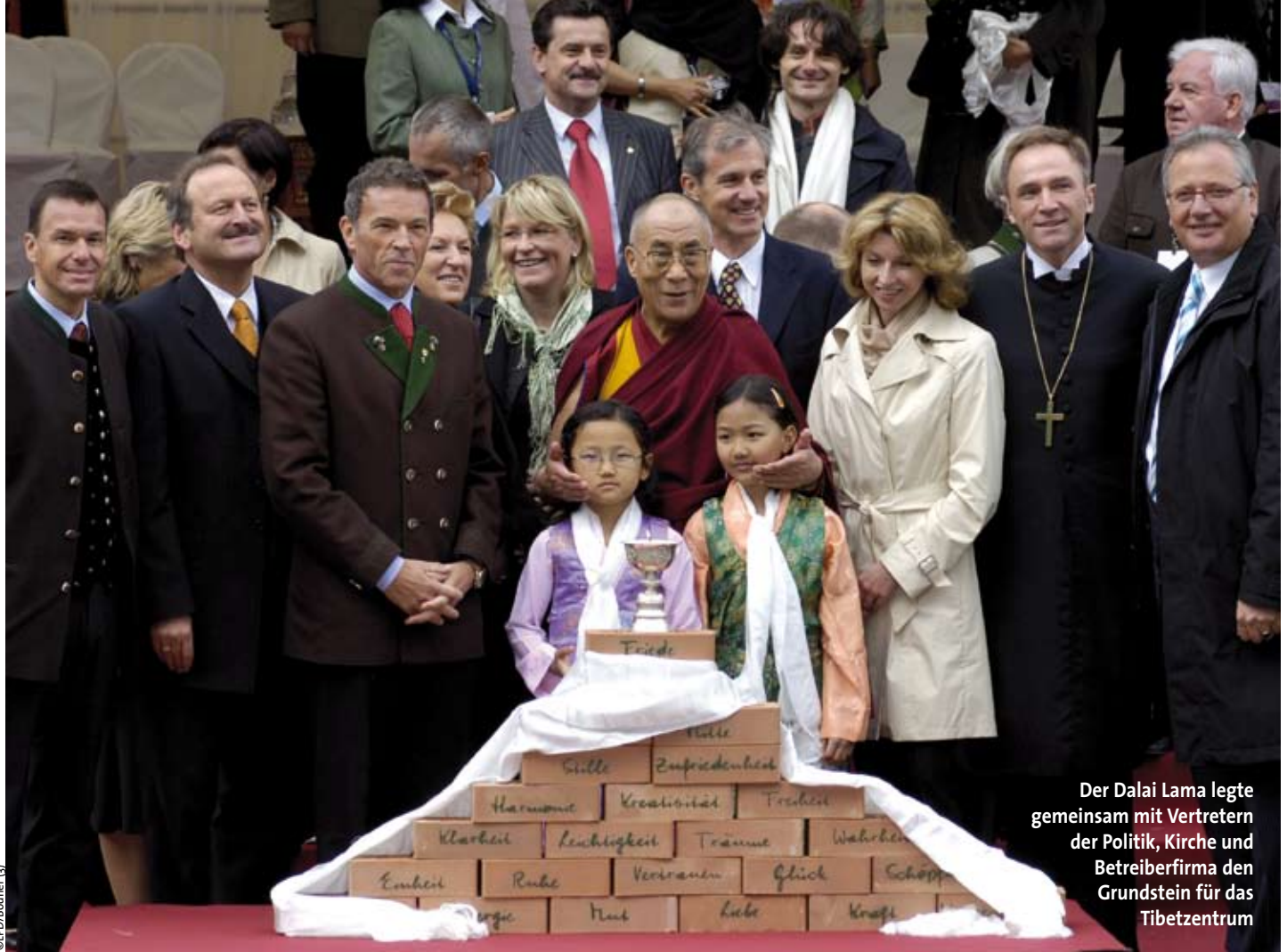
Der Dalai Lama legte gemeinsam mit Vertretern der Politik, Kirche und Betreiberfirma den Grundstein für das Tibetzentrum

Tradition treu bleiben, ein Konvertieren löst nämlich oft innere Verwirrung aus.